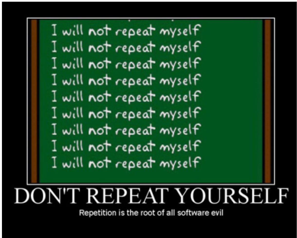
Figure .3: DRY!