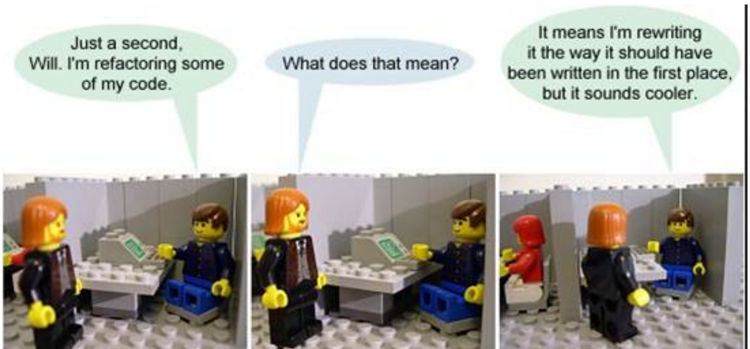
Figure .4: Qu'est-ce que le refactoring ?